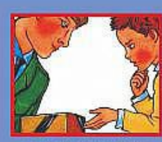
В ТРАНСПОРТЕ- ВОДИТЕЛЮ