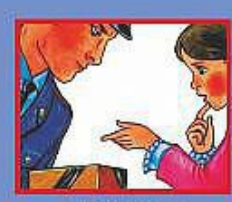
НА УЛИЦЕ ИЛИ В МЕТРО- ПОЛИЦЕЙСКОМУ