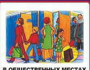
В ОБЩЕСТВЕННЫХ МЕСТАХ