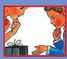
В МАГАЗИНЕ- ПРОДАВЦУ