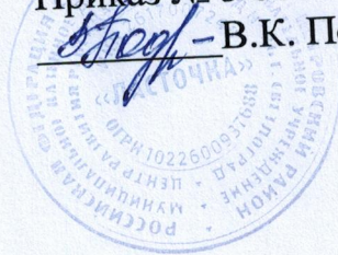
График и режим работы консультативного пункта МКДОУ ЦРР- ДС № 36 «Ласточка» г.Светлоград для родителей (законных представителей) , воспитывающих детей дошкольного возраста на дому на 2022-2023 учебный год.

Заседания консультативного пункта проходят в кабинете педагога- психолога во второй вторник каждого месяца с 13.30 до 14.30 часов.